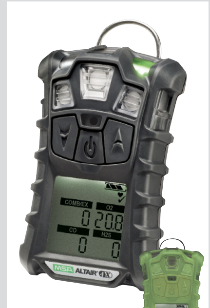
Fosforische behuizing beschikbaar

De ALTAIR Pompsonde voegt zich bij een productserie met een bewezen staat van duurzaamheid en functionaliteit.