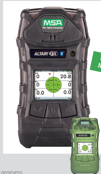
Fosforische behuizing leverbaar voor ALTAIR 5X met IR sensoren